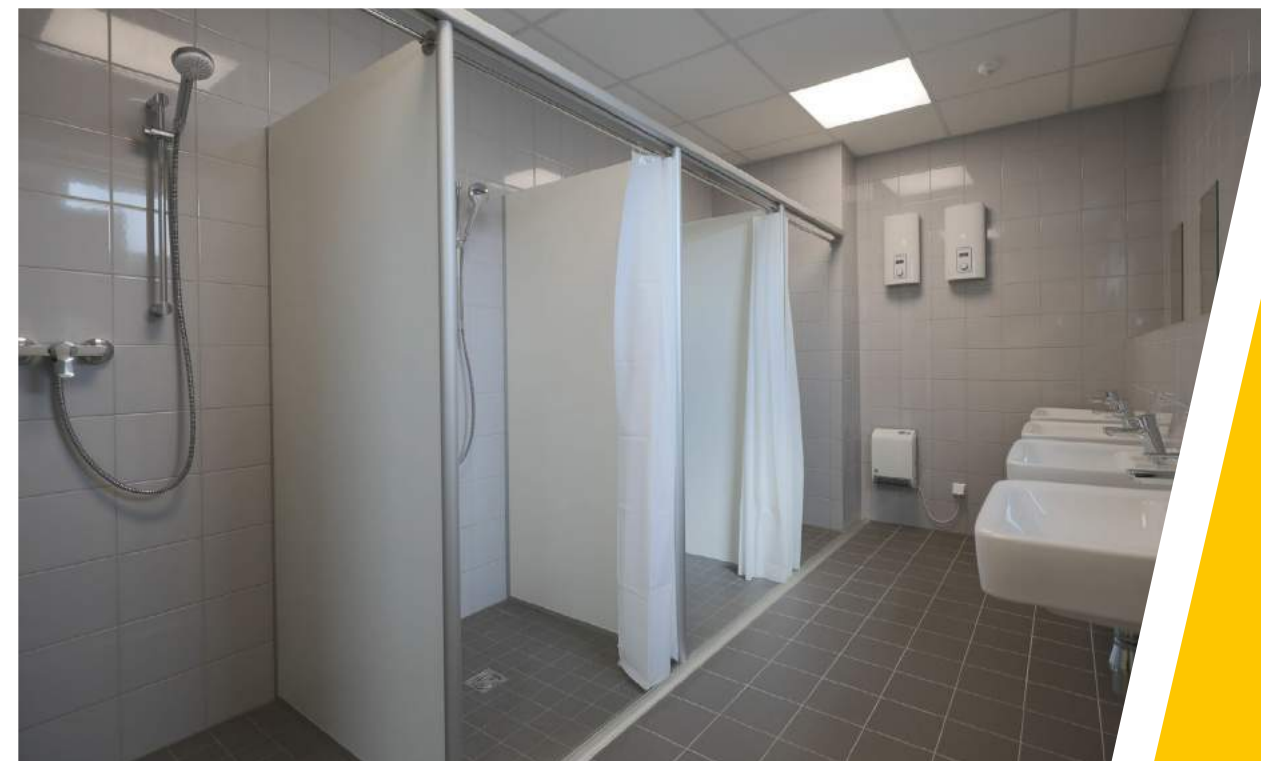
Sanitär- und Duschbereiche sind gefliest.

Insgesamt 800 Quadratmeter misst die zweistöckige Anlage.