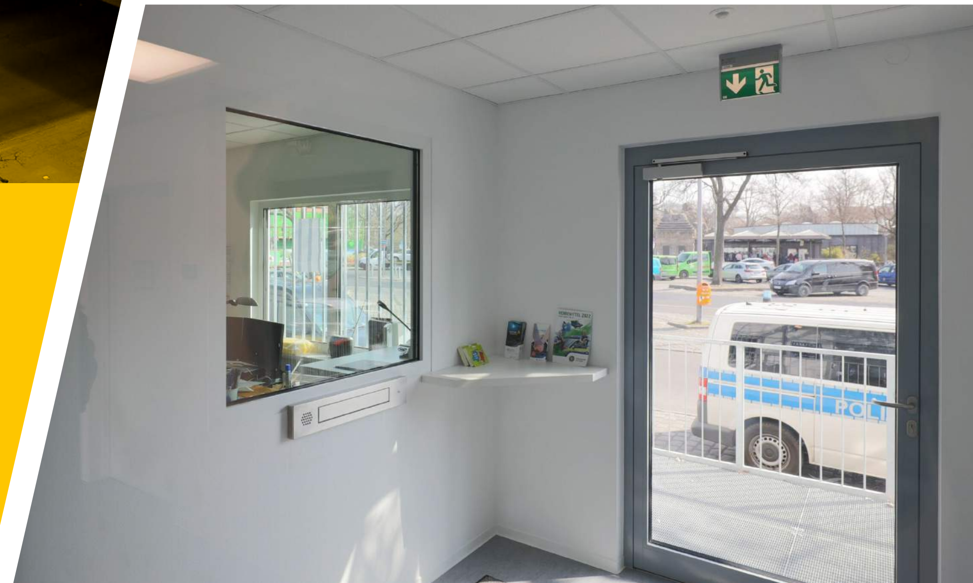
Ein Kundenwunsch: Die Schleuse im Eingangsbereich.

Insgesamt 800 Quadratmeter misst die zweistöckige Anlage.