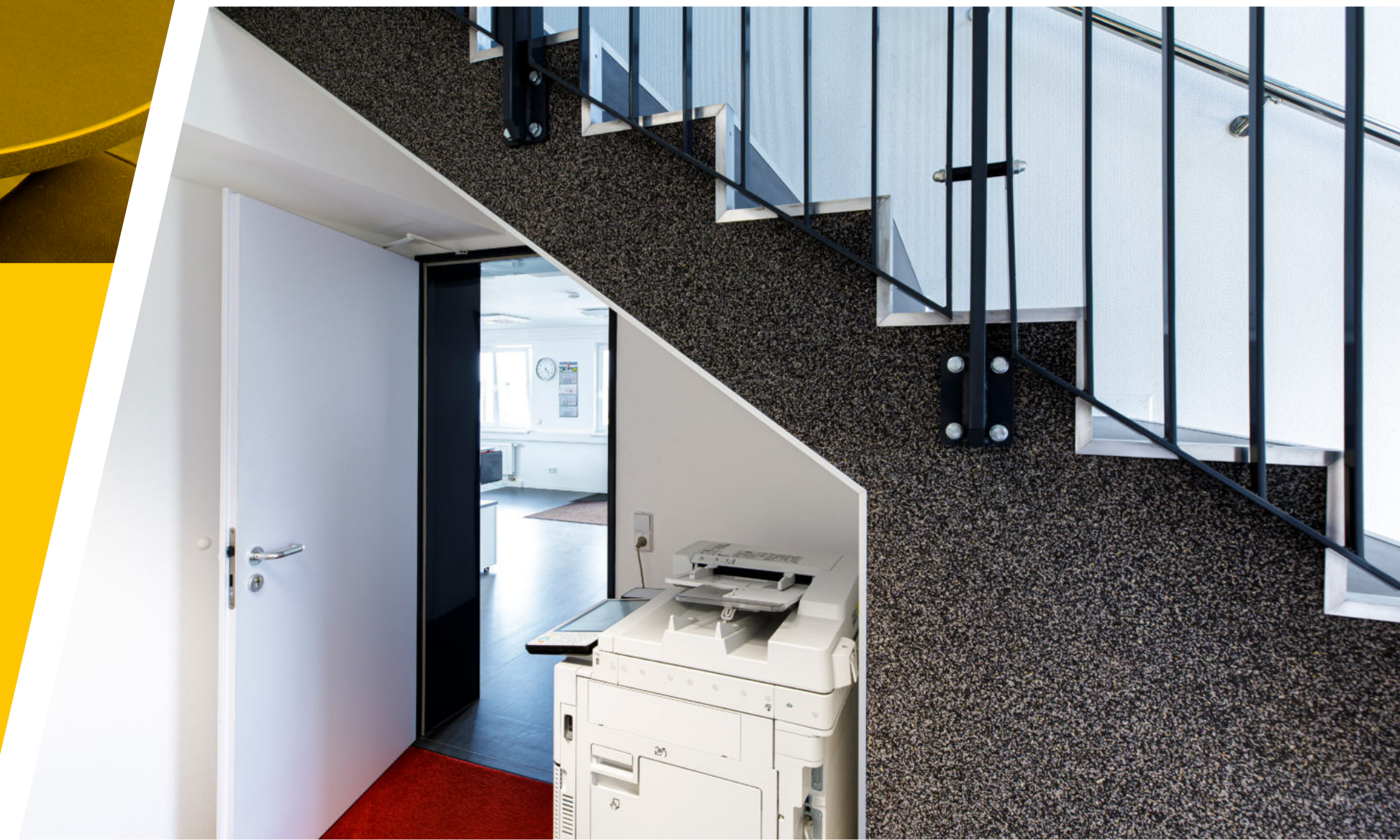
Der Neubau verfügt über zwei Stockwerke

I MASCHINEN- UND GERÄTEVERMIETUNG I TEMPORÄRE INFRASTRUKTUR I BAULOGISTIK