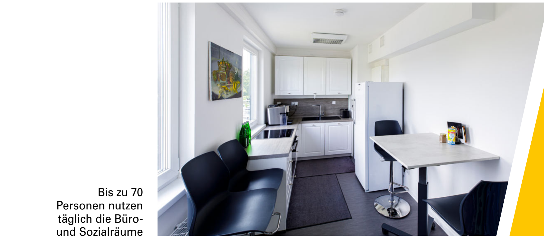
Bis zu 70 Personen nutzen täglich die Büro- und Sozialräume